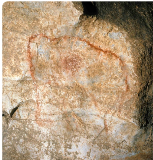
Mammoth ▲