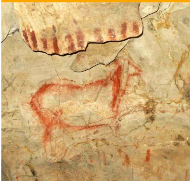
▲ Biche [S.R.]

Au nord, nous distinguons trois secteurs. A environ 200 m de l'entrée, le Panneau Principal concentrant la grande majorité des peintures et gravures de la grotte. Sur un mur d'environ 10 mètres de long l'on observe, avec plus ou moins de clarté, une série de représentations peintes en rouge. Il s'agit de six figures animales (trois bisons, une tête de cheval, une biche et une représentation de mammoth) et de plusieurs motifs à caractère abstrait, regroupés dans des ensembles ordonnés ou individuellement répartis sur le mur: des traits linéaires et des bâtons, des séries de points,